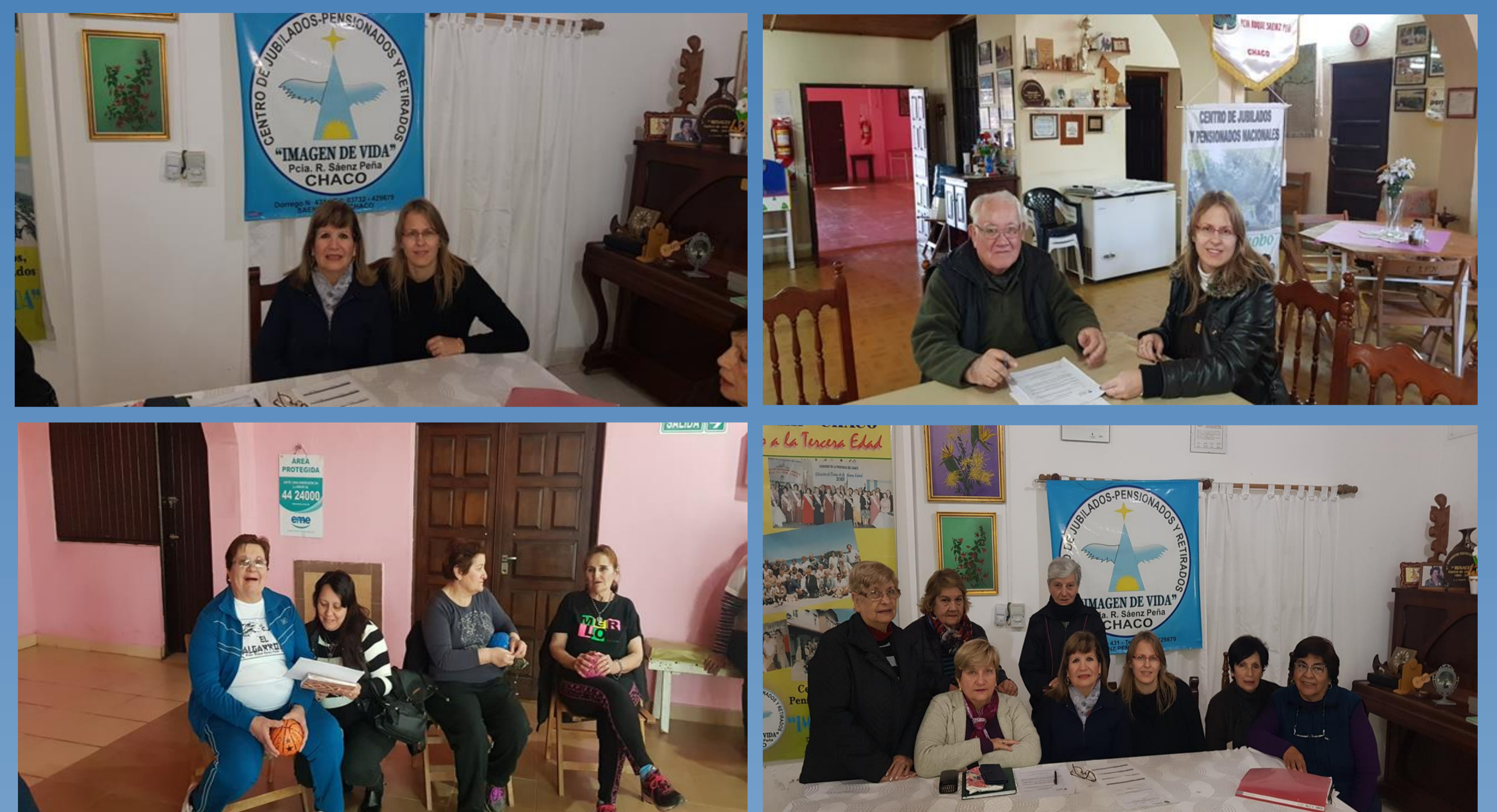
Fig. 1. Entrevistas realizadas a los adultos mayores de los centros de jubilados, pensionados y retirados.

Como conclusión podemos decir que el uso adecuado y racional de las plantas medicinales no debería producir efectos adversos graves en las personas sin embargo es necesario contar con información fidedigna para evitar esos efectos adversos y posibles interacciones con especialidades medicinales o alimentos co-administrados.