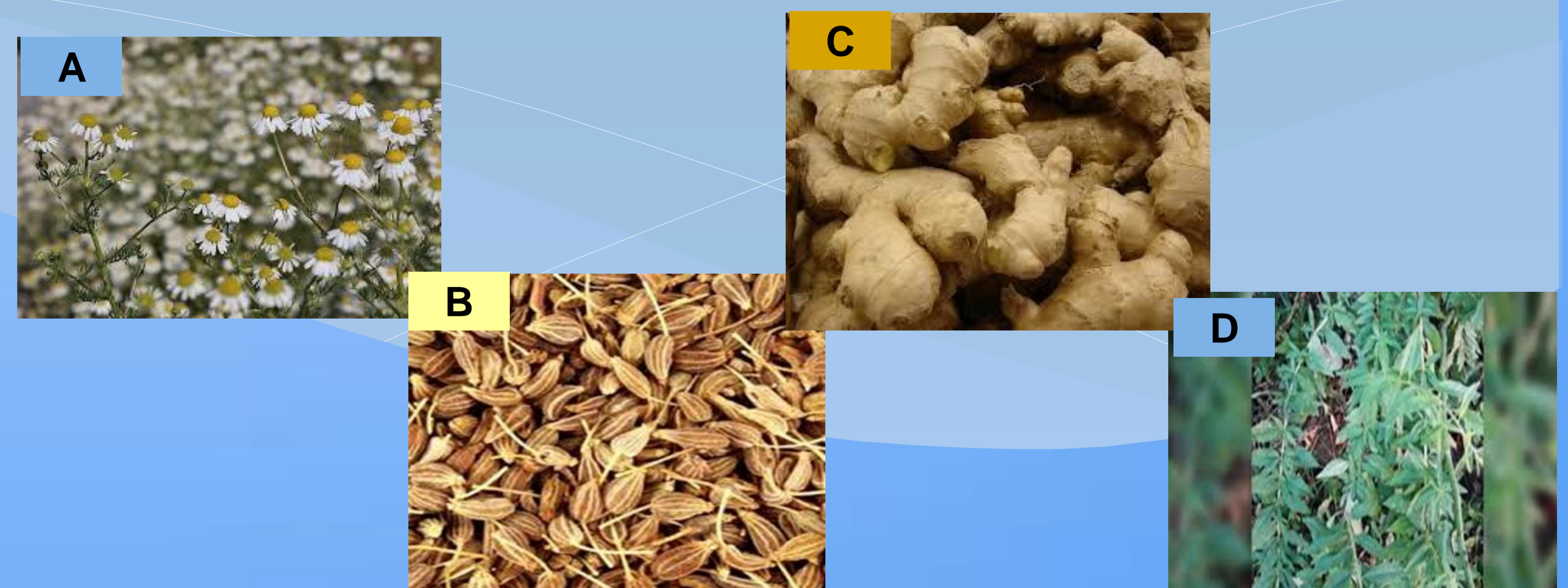
Fig. 3. Según los resultados de las encuestas entre las plantas medicinales más consumidas se encontraban: (A) manzanilla, (B) anís en grano, (C) jengibre y (D) burrito.