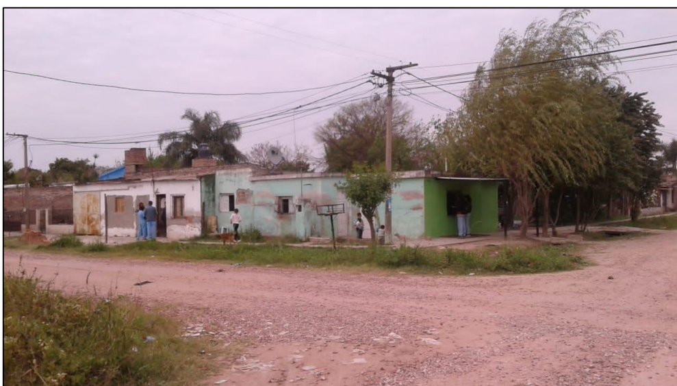
Estudiantes realizando entrevistas en el Barrio San Cayetano.

Durante el periodo julio-diciembre 2019, se realizó un estudio descriptivo-transversal del Barrio San Cayetano tras la concreción de 497 encuestas completadas mediante entrevistas, con las que se logró obtener información sobre determinantes de salud de 1413 personas.